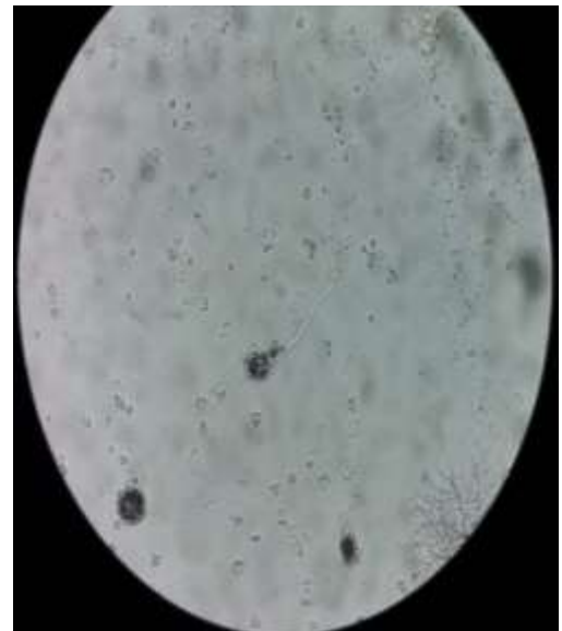
Jamur kontaminan Aspergillus sp