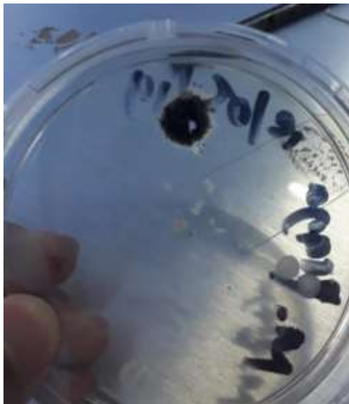
Media SDA yang ditumbuhi jamur kontaminan Aspergillus sp