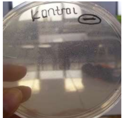
Media Kontrol SDA